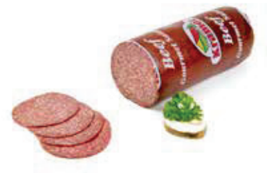
617 1, 2, 6, i, j Rinder-Salami, leicht rein Rind 2 kg