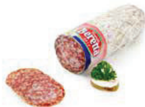
624 1, 2 Original Mailänder Salami „Beretta“, natur gereift 2 kg