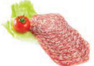
6241 1, 2 Original Mailänder Salami, geschnitten „Beretta“, natur gereift Aromapack, 0,5 kg