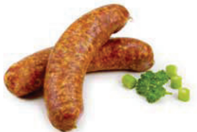
602 1, 2 Gerauchte Bauernbratwurst Buchmann's LandSchwein 5 Paar à 160 g, Aromapack, 0,8 kg