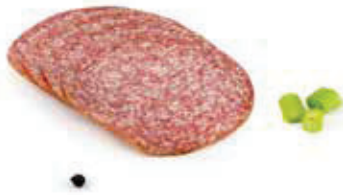
600i 1, 2 Salami „Hausmarke“ geschnitten, Aromapack 0,5 kg