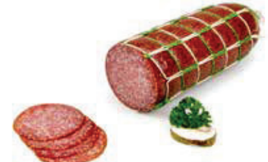
618 1, 2, 3, g, j Puten-Salami rein Pute 2 kg