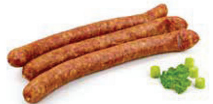
603 1, 2 Pfefferbeisser 5 Paar, Aromapack 0,75 kg