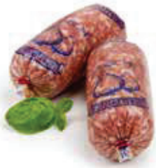
605 1, 2, 3, 8 Zwiebelmettwurst 5 Stück à 150 g, Aromapack 0,75 kg