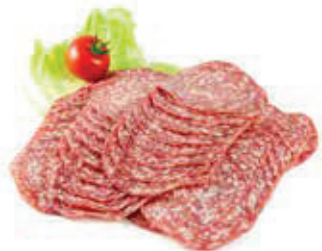
616 1, 2, 3, g, j Pizza-Salami, geschnitten Aromapack 1 kg