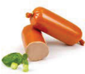
607 1, 2, 5, i, j Streichmettwurst, klein 5 Stück à 150 g, Aromapack 0,75 kg