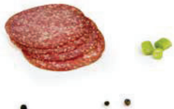
6181 1, 2, 3 Puten-Salami, geschnitten rein Pute Aromapack, 0,5 kg