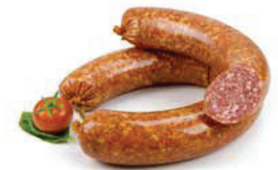
604 1, 2, 3, 6, 8, 9 Grobe Mettwurst im Ring geräuchert, Aromapack 1,1 kg