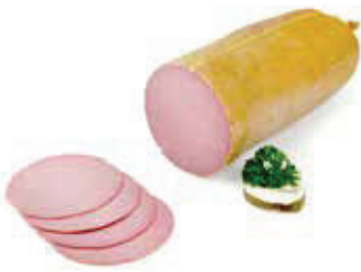
613 1, 2, 3, j Cervelat la Prima Fettdarm 3,5 kg