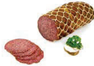
610 1, 2, g, j Edel-Salami Spitzenqualität, im Netz, 2,5 kg