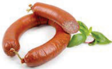
621 1, 2, 3, 6, i, j Knoblauchwurst, im Ring Schwarzwälder 1 kg