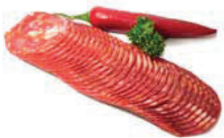
632 2, 3, 4, 9, f, g Spanische Paprika-Salami „Chorizo“, geschnitten Aromapack, 0,5 kg