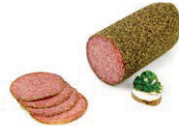
612 1, 2, 3 Pfeffer-Salami mit Pfeffer ummantelt 2 kg