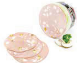
625 1, 2, o Original italienische Mortadella „Beretta“, halbe Stücke, Vac 2,5 kg