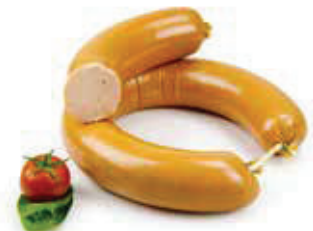
606 1, 2, 5, i, j Streichmettwurst im Ring geräuchert, Aromapack 1 kg