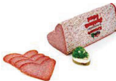
622 1, 2, 3, 6, i, j Herz-Salami „Kramer“ 1,5 kg