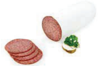
611 1, 2, 3, g, j Weißer Salami la Spitzenqualität 2 kg