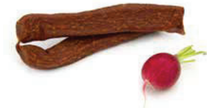
6012 1, 2, 3, 5, 6, 8, i, j Landjäger „Allgäu“ Pack à 10 Paar, Aromapack 0,95 kg