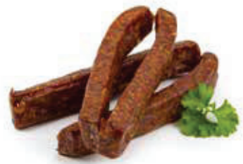
601 1, 2, 3, 5 Landjäger Pack à 10 Paar, Vac 0,95 kg