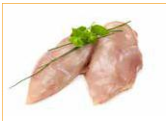
265 Hähnchen-Brustfilet Stück ca. 200 g, Vorbestellung, frisch Vorgabe