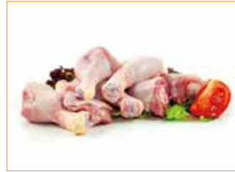
287 Hähnchen-Unterkeulen, natur Alpikal Stück à 60 - 80 g, 2,5 kg