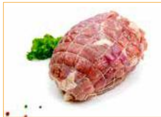
257 Puten-Rollbraten aus der Oberkeule, frisch 0,8 kg