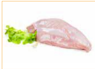
2531 Puten-Brust deutsch halbe Stücke, Vac, frisch 2,2 kg