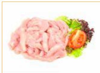
2851 Hähnchen-Brust geschneuzelt, natur Alpikal Menge nach Vorgabe, Vac