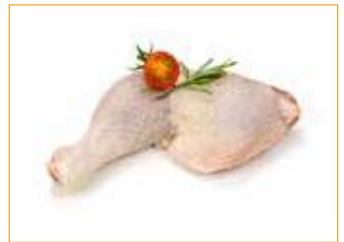
264 Hähnchen-Schenkel Stück ca. 250 g, Vorbestellung, frisch Vorgabe