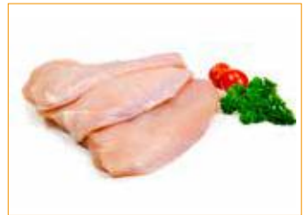
254 Puten-Schnitzel ca. 150 g / Stück, frisch 0,15 kg