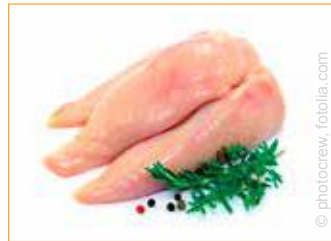
25301 Puten-Brust Gut Neuhof 2 halbe Stücke 4 kg