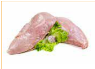
253 Puten-Brust deutsch doppelt, Vac, frisch 4,5 kg