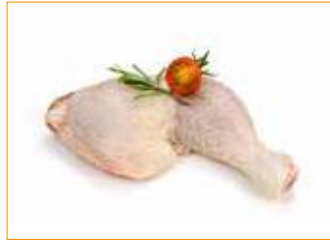
2821 Hähnchen-Keulen mit Rückenstück Alpikal, Stück à 260 g, 2 kg