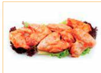
286 Hähnchen-Flügel mit Bein, gewürzt Alpikal Stück à 85 - 100 g, 2 kg