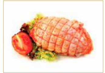
288 Hähnchen-Keule Rollbraten, gewürzt Alpikal, Stück à 500 g