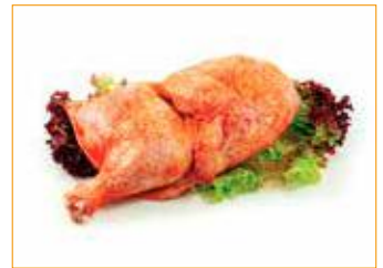
284 Hähnchen halb, gewürzt Alpikal Stück à 500 g