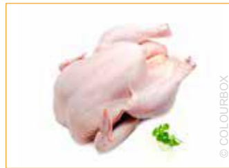
263 Hähnchen-Griller ungewürzt, Vorbestellung, frisch 1,1 kg