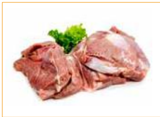
256 Puten-Oberkeulen ohne Haut / ohne Knochen, frisch 3 kg